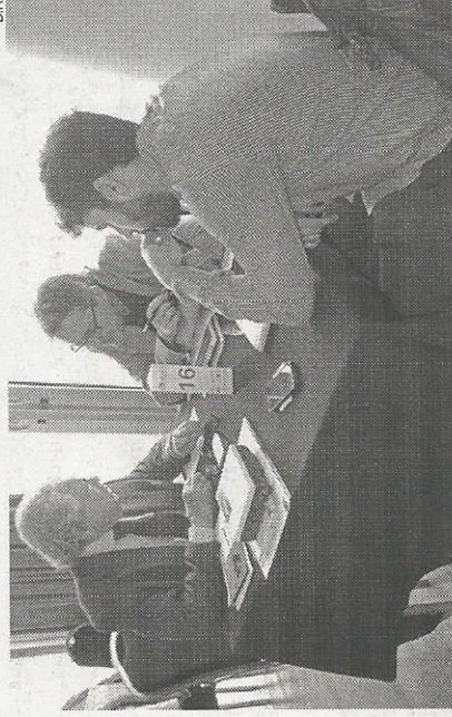
Evento visou projectos do Cluster Habitat Sustentável

Promovido pelo “Cluster Habitat”, em colaboração com a AIDA (Associação Industrial do Distrito de Aveiro), este evento pretendeu estabelecer um espaço para a promoção da